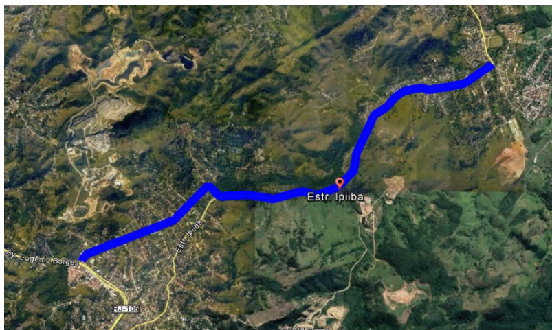
Figura 1 - Estrada de Ipiiba completa, ligando os bairros de Rio do Ouro e Santa Isabel

Para complementar o projeto de toda a via, serão realizados processos de contratação independentes para cada trecho.