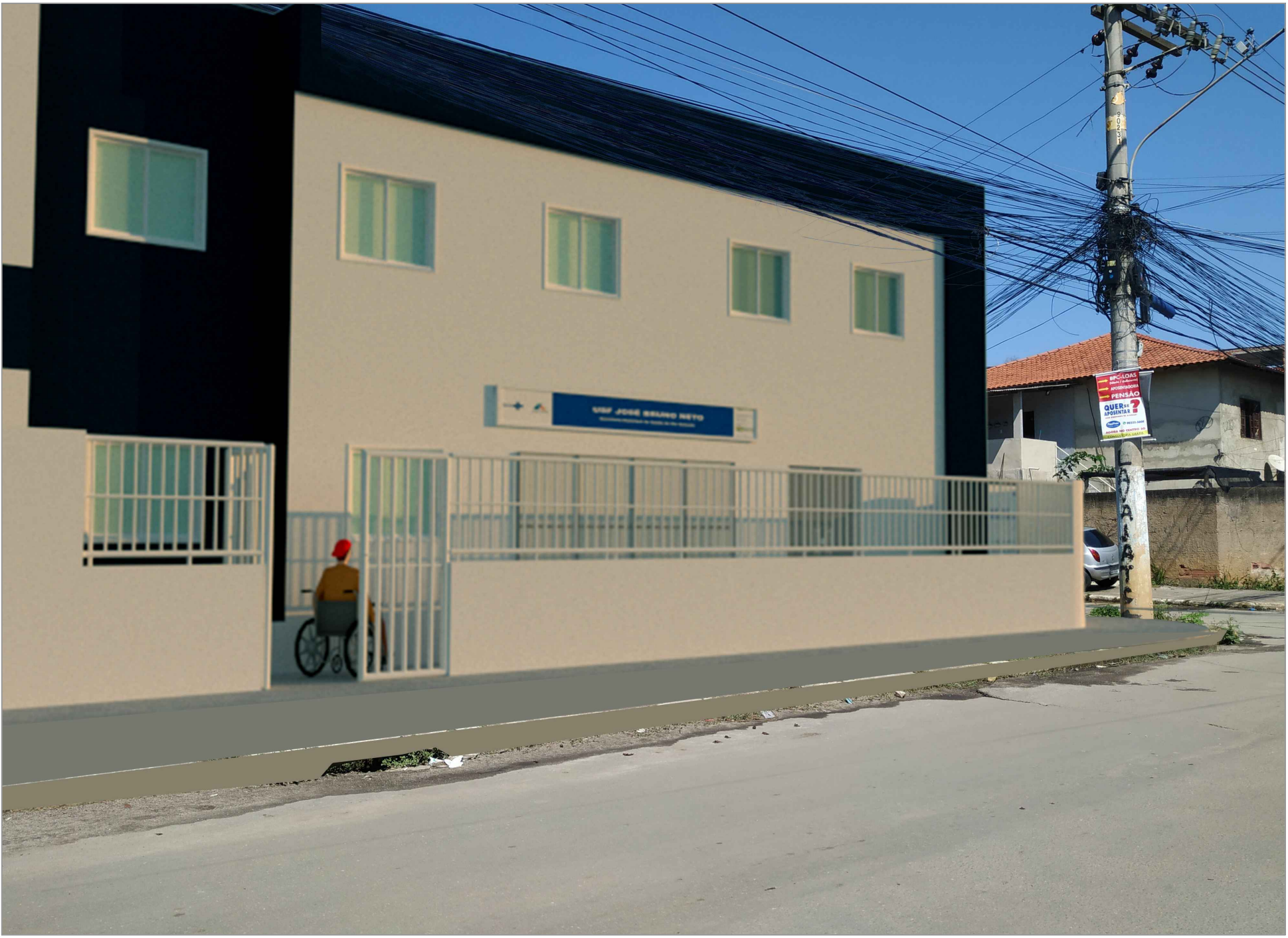
2 PERSPECTIVA SEM ESCALA