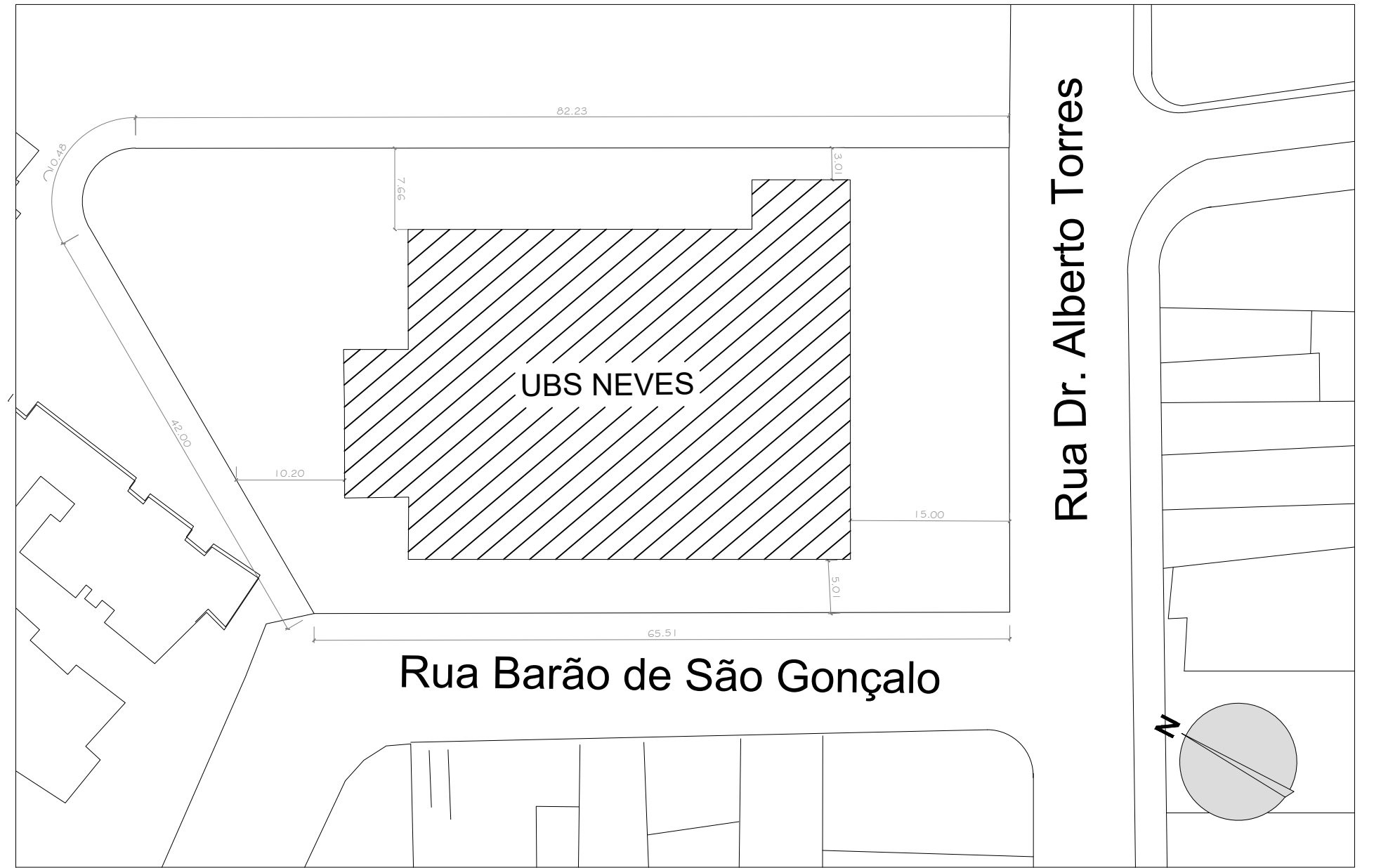
1 PLANTA DE LOCALIZAÇÃO ESC.: 1/500