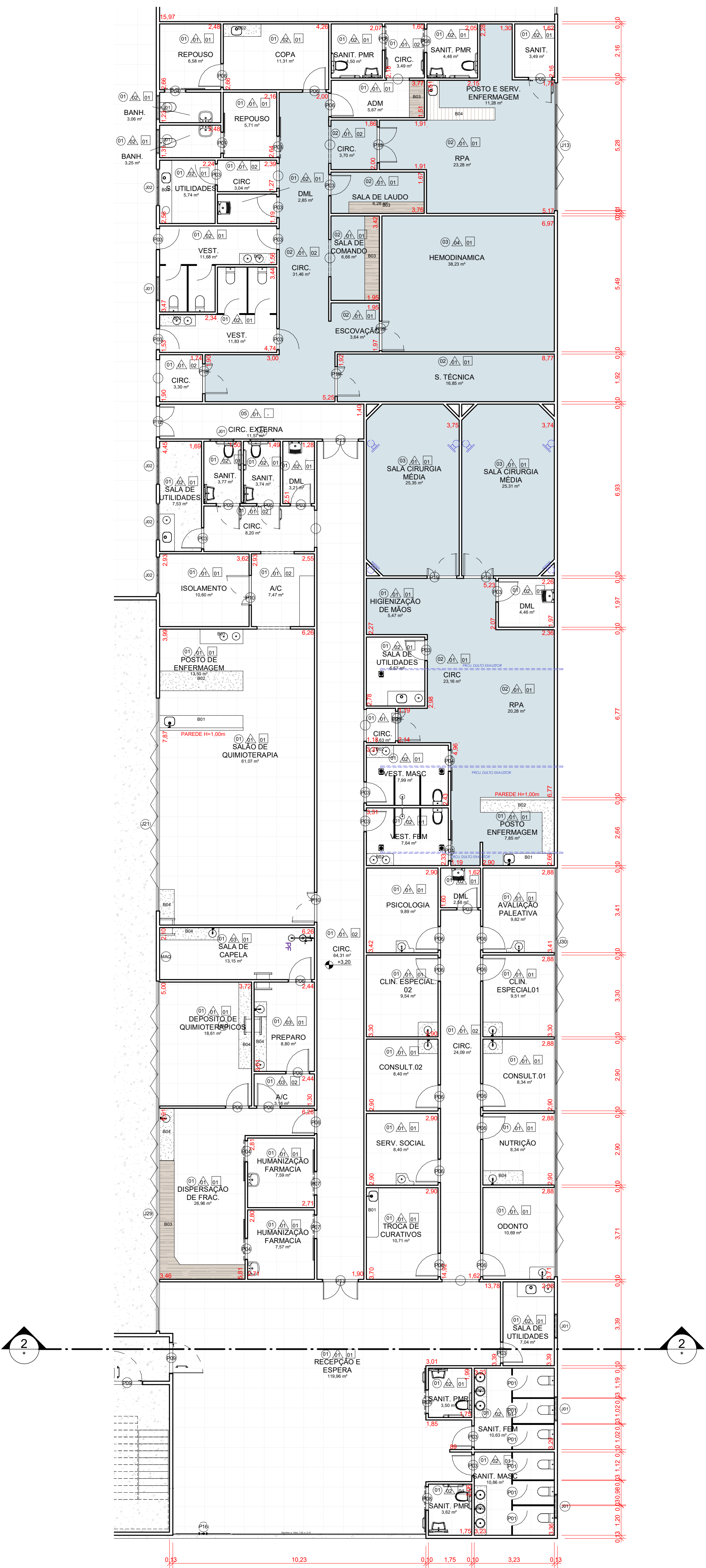
1 TÉRREO - UNACOM / HEMODINAMICA