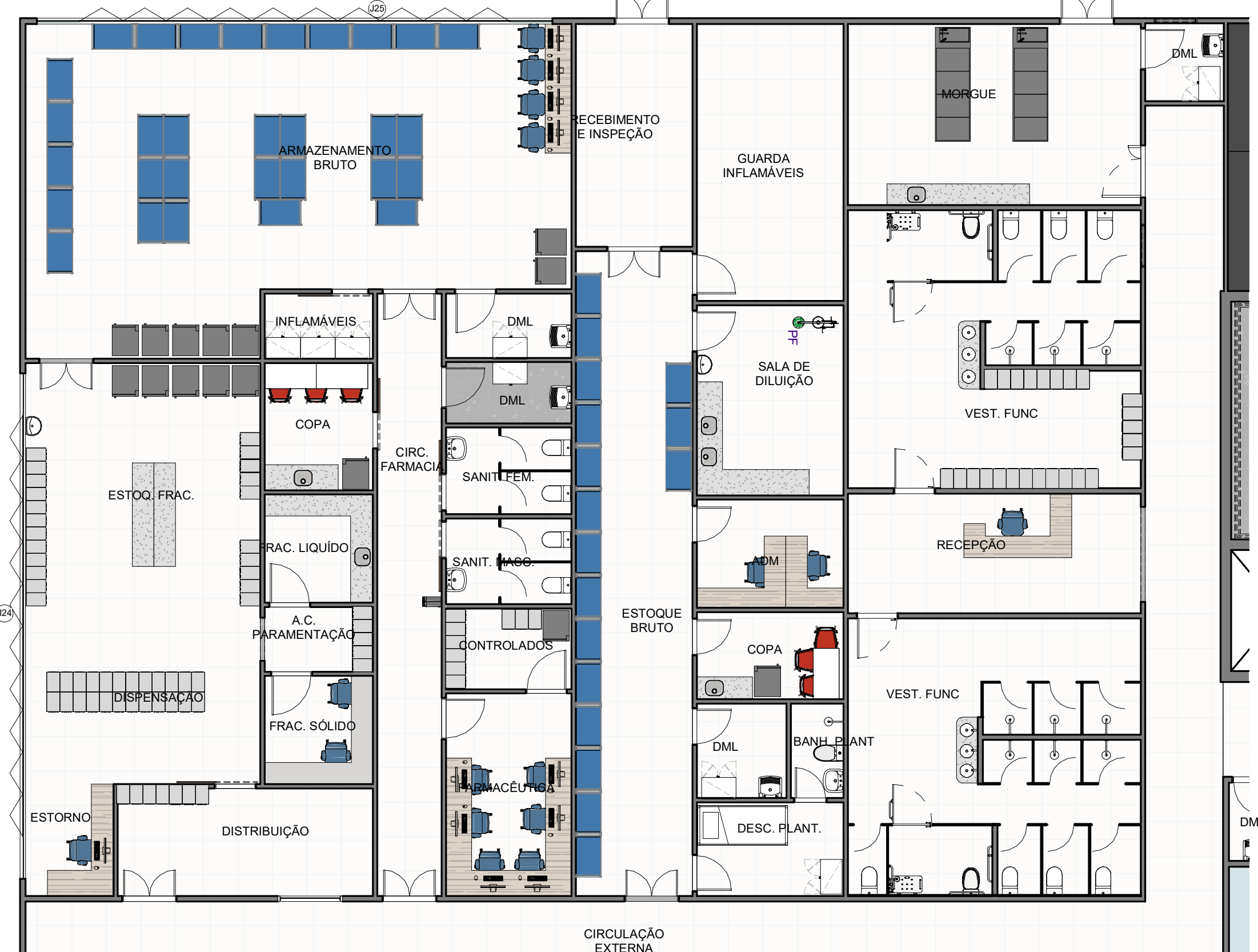
F TÉRREO LAYOUT - FARMACIA / APOIO