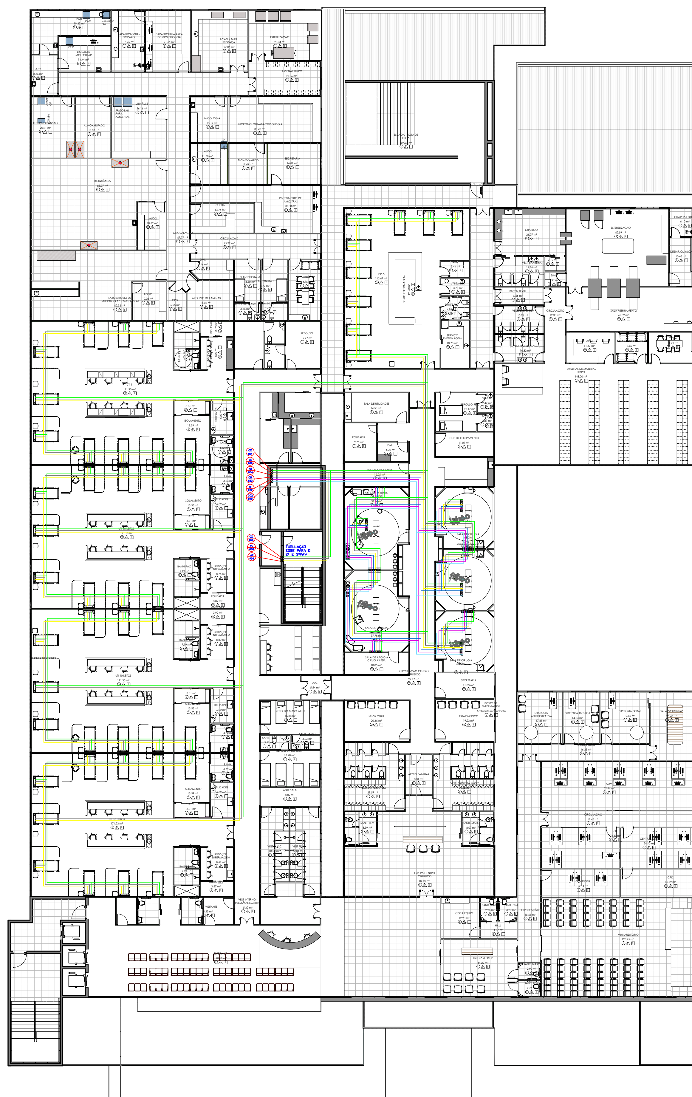
02 PROJETO GASES MEDICINAIS - 1º PAVIMENTO ESC.: 1/200