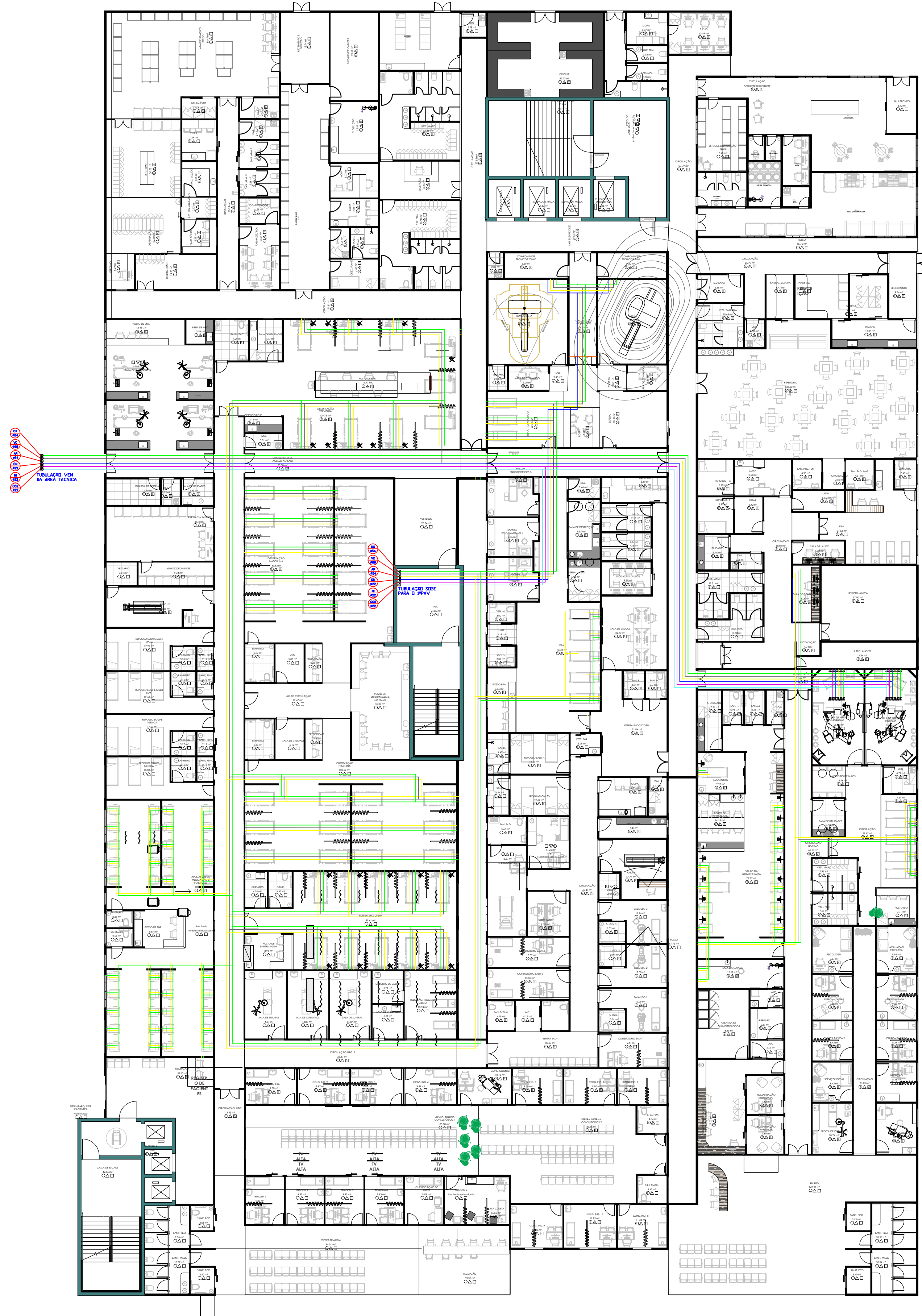
01 PROJETO GASES MEDICINAIS - TÉRREO ESC.: 1/200