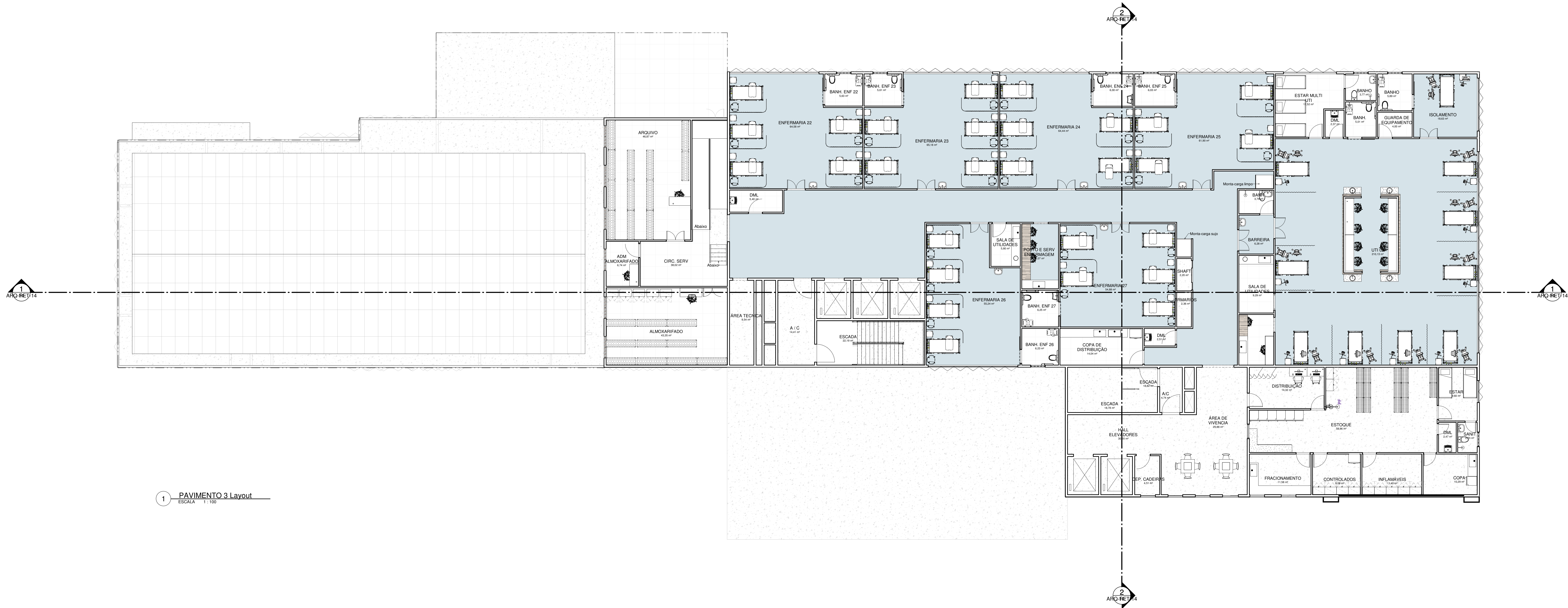
1 PAVIMENTO 3 Layout ESCALA 1:100