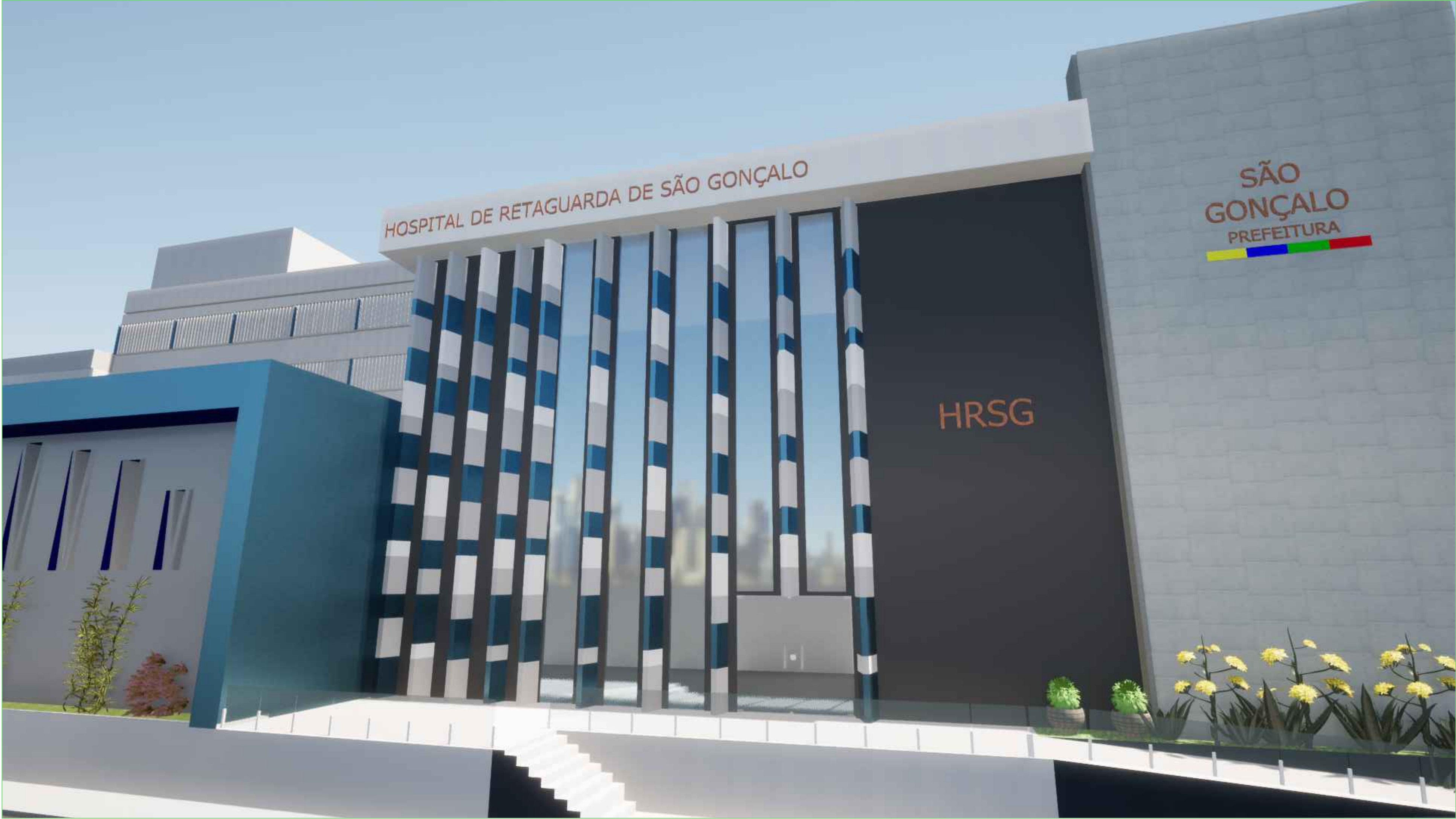
02 PERSPECTIVA ESC.: 5/ESCALA