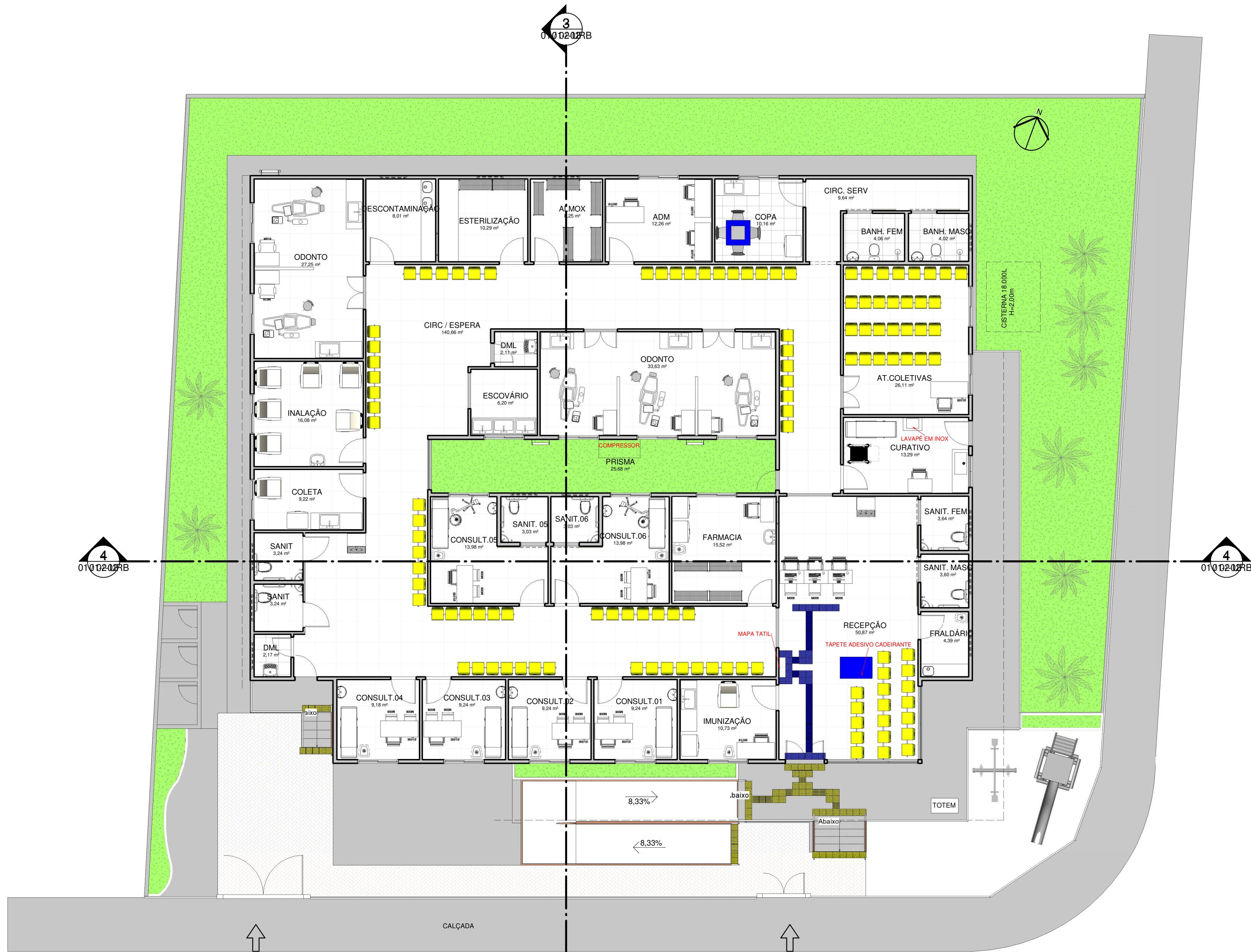
2 TÉRREO LAYOUT ESCALA 1:100