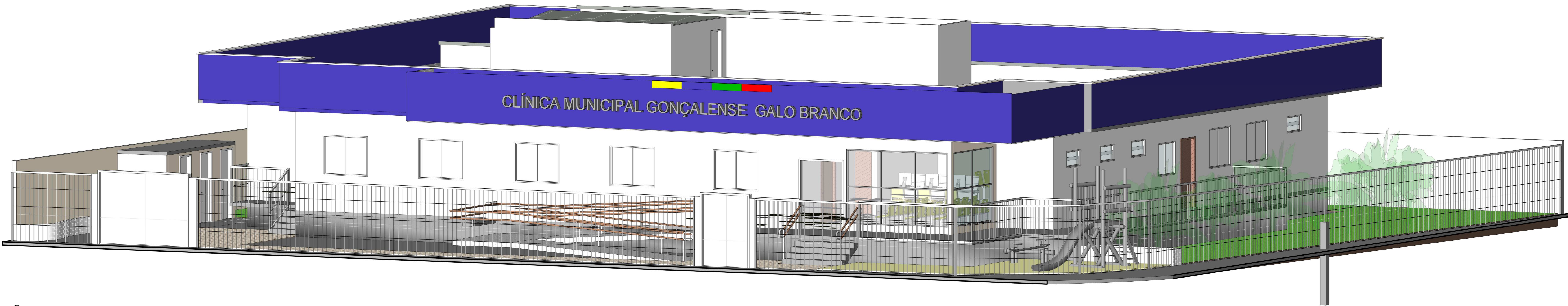
4 PERSPECTIVA Copiar 1