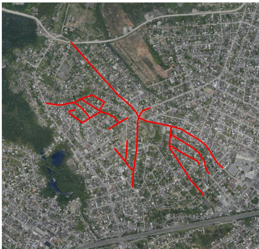
Mapa Itaúna e Porto do Rosa

2.6.4. Relação dos logradouros onde serão realizados os serviços previstos neste Projeto Básico: