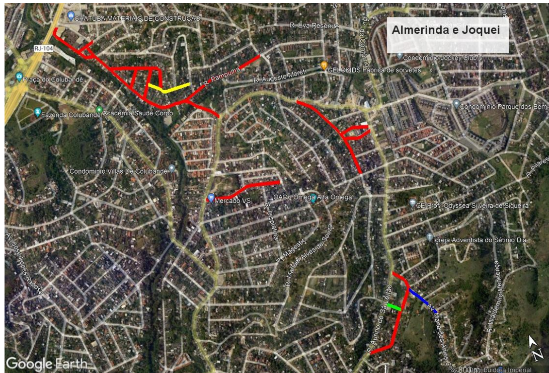
Mapa Almerinda e Jockey