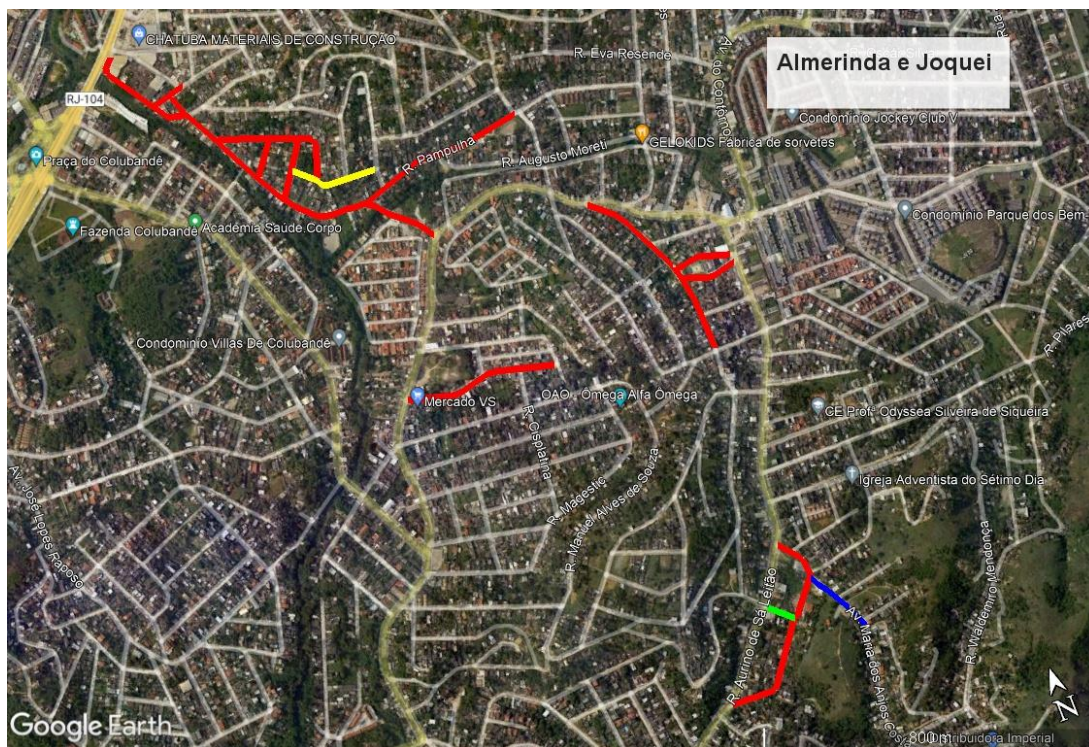
Mapa Almerinda e Jockey