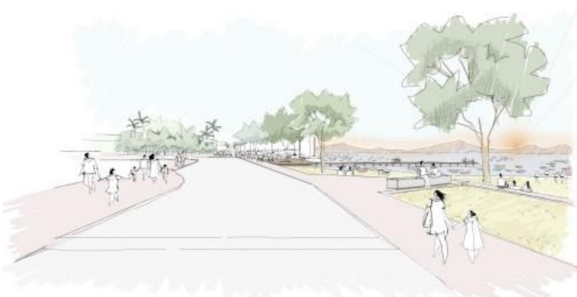
Figura 2 - Proposta Orla.