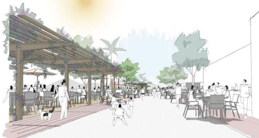
Figura 3 – Proposta Calçadão.

PERSPECTIVA RUA COMPARTILHADA DURANTE FINAIS DE SEMANA E FERIADOS