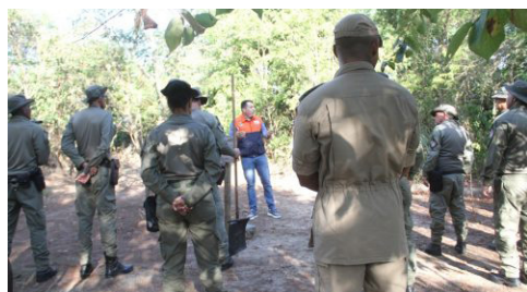
Guardas Municipais são capacitados para combater incêndios na mata

LEIA AS MATÉRIAS NO SITE OFICIAL DA PREFEITURA