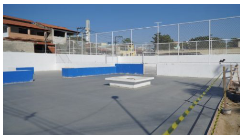
Obras na Praça da Lagoinha recebem ajustes finais