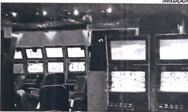
Mais de 200 equipamentos foram localizados no bairro de Bonsucesso

De acordo com a PF, após o levantamento de dados de inteligência e trocas de informações, policiais federais e agentes da Seop identificaram um estabelecimento onde era mantida, de forma clandestina, uma estrutura voltada para a prática de jogos de azar. Foram apreendidas 211