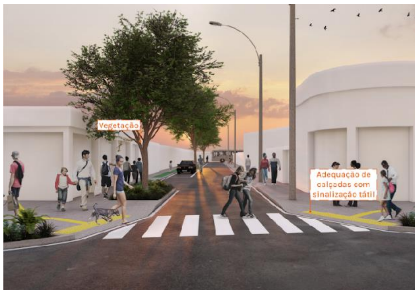
Figura 4 – Proposta Mario Miranda.

Resultado esperado: Obras de Reforma e Requalificação Urbana para o bairro do Alcântara, São Gonçalo/RJ.