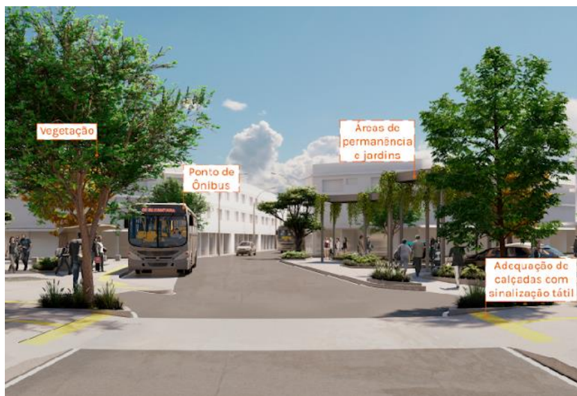
Figura 1 – Proposta Rotatória.

Necessidade: A realização dos projetos de Requalificação Urbana do Centro do Bairro Alcântara tem por objetivo trazer maior qualidade para a região e garantir a segurança viária dos diversos modais que circulam pela região. As diretrizes projetuais são: a caminhabilidade, a priorização dos transportes coletivos, a expansão da rede cicloviária e o adensamento da arborização. Serão realizadas ações de intervenções urbanas que abarcam áreas de pedestres e meios de transporte ativos e motorizados, além do mobiliário urbano e a acessibilidade. Abaixo é possível verificar algumas imagens do projeto, que busca apresentar as propostas feitas na fase projetual.