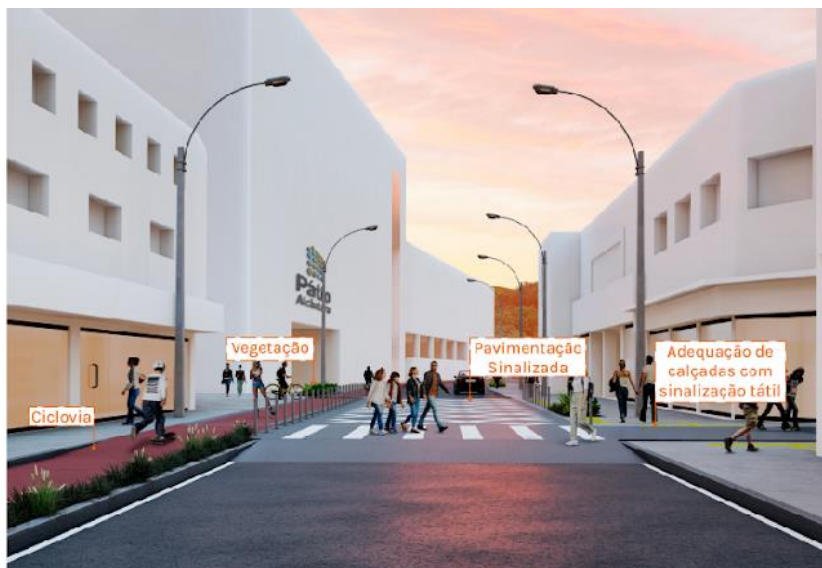
Figura 2 - Proposta Backer.